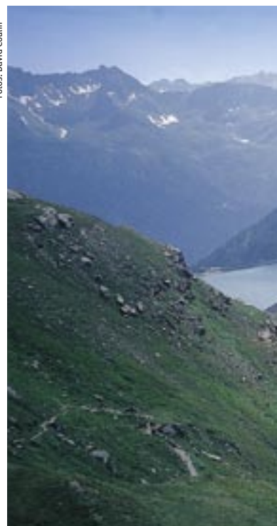
Der Ritomsee ist ein Stausee, deshalb gilt hier: Baden strikte verboten!