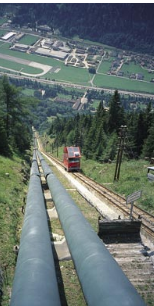
Steile Angelegenheit: Standseilbahn Ritom-Piora. Die Steigung des Trassees beträgt 87,8%.

Für nicht wenige Zustiege zu SAC-Hütten gehören Badehosen obligatorisch in den Rucksack. Zum Beispiel auch für die Cadlimohütte. Sie bietet dank der Erweiterung vor 1½ Jahren nicht nur 88 Schlafplätze, sondern auch vielfältige Tourenmöglichkeiten.