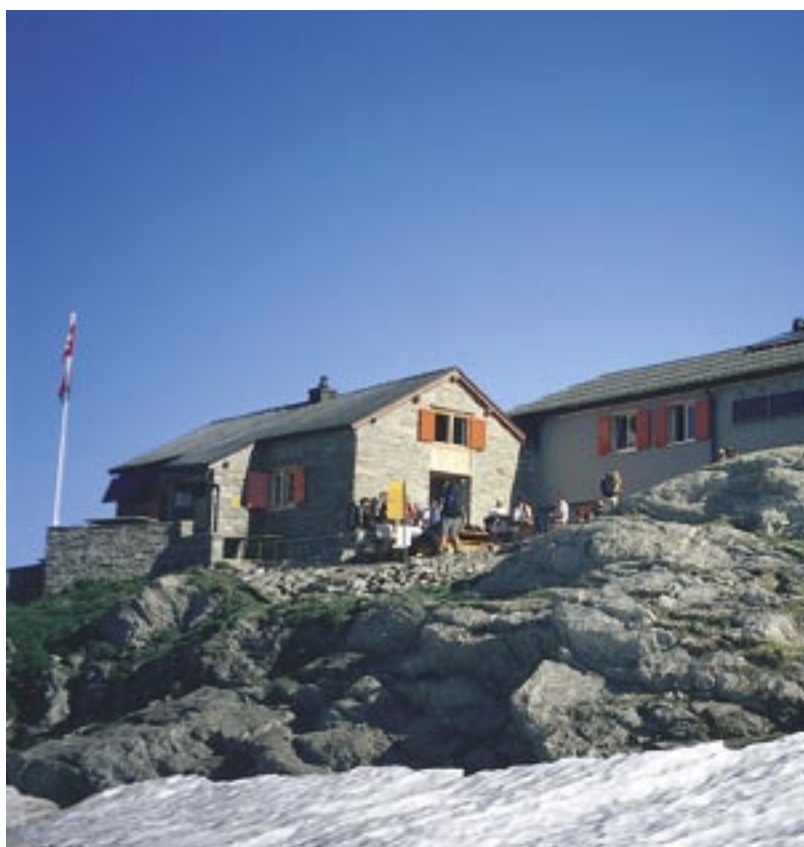
Die umgebaute Cadlimohütte bietet neu 88 Schlafplätze.

tert, fügt sich aber auch mit dem Erweiterungsbau so gut in die Umgebung ein, dass sie vor dem felsigen Hintergrund nur schwierig auszumachen ist. Umso heller und geräumiger zeigt sie sich von innen.