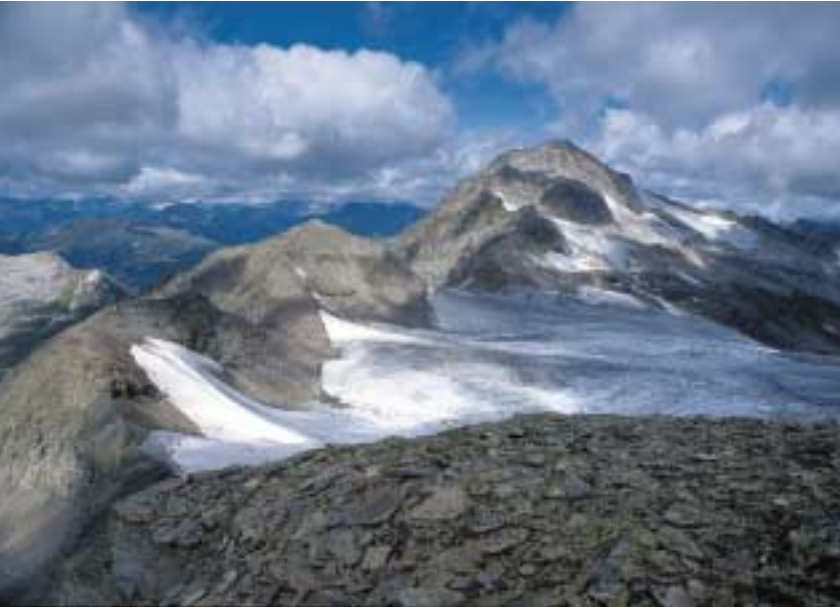
Der Pizzo Baratin (ganz links), die Lögia und das Rheinwaldhorn vom Pizzo Cramorino