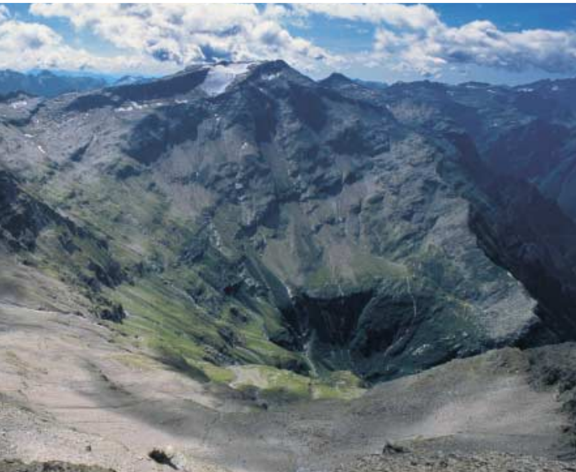
Blick vom Pizzo Cramorino auf die Cima Rossa; im Vordergrund der Talkessel der Alpe di Giumello