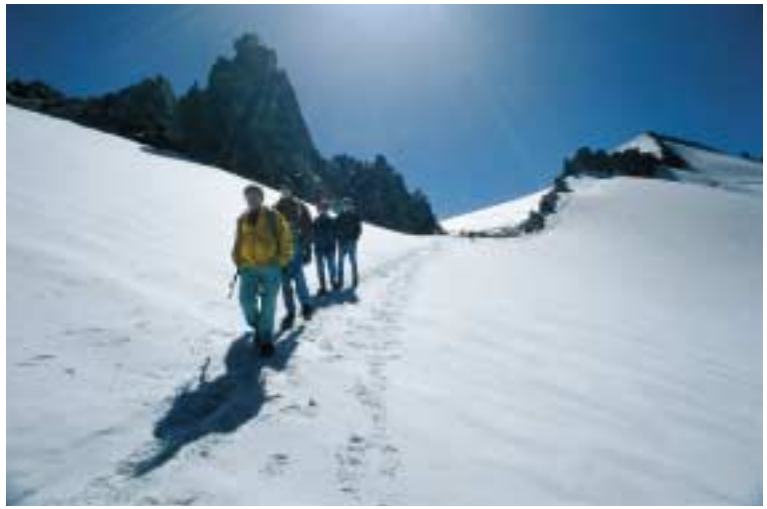
Abstieg vom Gipfel des Rheinwaldhorns