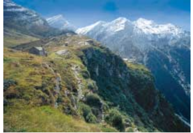
Blick auf die Capanna Adula SAC

Der Adula-Gletscher, der auch unter dem Namen Vadrett di Bresciana bekannt ist, berührte vor 60 Jahren noch den heutigen Weg. Dort, wo der Wanderer heute ruhig durchgeht, gab es damals fünf Meter hohe Eis- und Schneemauern! Diese Vorstellung lässt uns schauern, während wir von einem Stein zum andern über den Wildbach, der aus dem Innern des Adula-Gletschers hervorsprudelt, hüpfen.