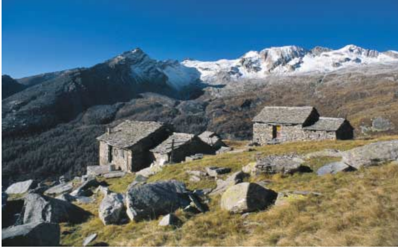
Zuhinterst im Val Malvaglia; Ürbell bei der Alpe di Quarnéi

Das Ziel der zweiten Etappe ist Ghirone, das man in sechs bis sieben Marschstunden erreicht, indem man über den Passo del Laghetto geht und das lange Val di Carassino bis zum Luzzone-Stausee (Lago di Luzzone) durchquert. Von der Hütte folgt man dem steilen Weg zum Passo del