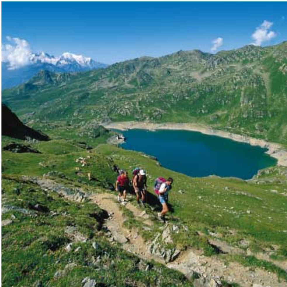
Unmittelbar vor dem Col de Fenestral; Blick auf den Lac de Fully