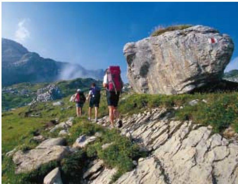
Beim Aufstieg zum Col des Essets (2029 m)