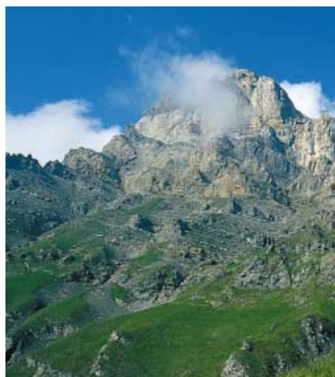
Querung unter den Dents de Morcles durch von La Tourche nach Demècre