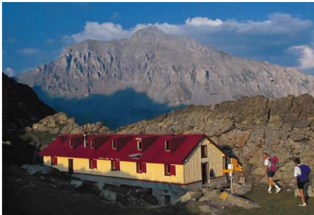
Cabane du Demècre (2361 m)