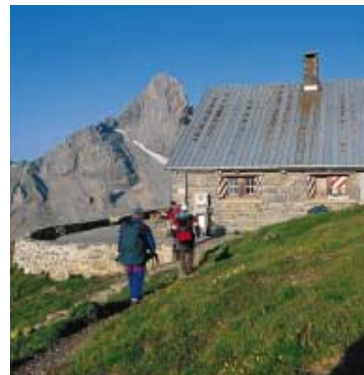
Ankunft bei der Cabane Rambert (2580 m)