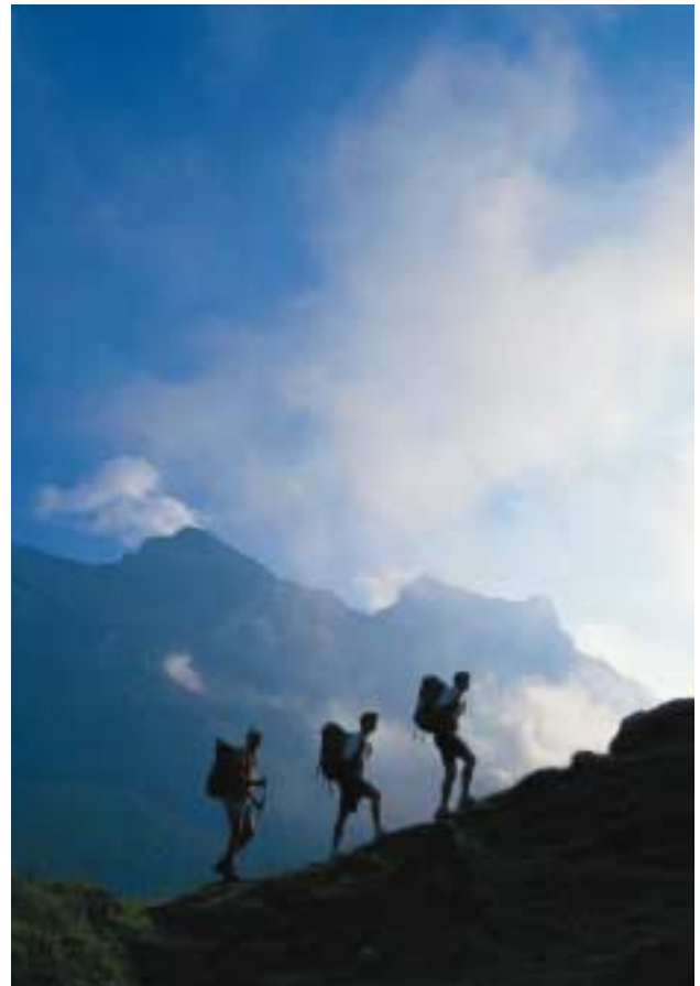
Alp La Vare, Blick auf den Grand Muveran

Moräne, steigt über sie und dann über die letzten Zickzackkehren in den Col des Perris Blancs (2544 m) auf. Auf einen ersten steilen Abstieg zur Vire des Bœufs (2343 m) folgt eine grosse Querung, die auf einen Grashang über der Cabane de La Tourche hoch über der Rhoneebene führt. Anfang der Saison oder bei noch liegendem Schnee ist es sinnvoll, für diesen steilen und stellenweise ausgesetzten Abstieg Pickel und evtl. sogar Steigeisen mitzunehmen.