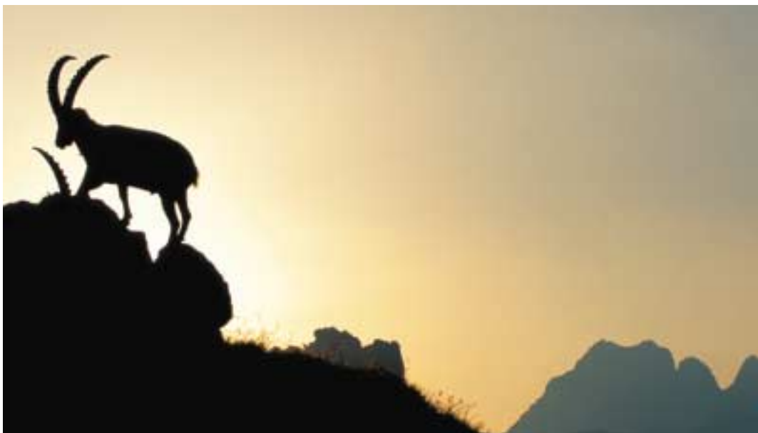
Märchenhafte Stimmung bei der Cabane Rambert

Von der Cabane Rambert nimmt man den Weg, der nach NE und über einen wenig steilen Weg zu einem grossen Geröllfeld hinunterführt. Man quert zahlreiche Runsen in einem strengen Ambiente, das vom Grand Muveran überragt wird. Fast direkt unter der Dent de Chamossentse (bei Les Outannes) geht der Weg nach N weg und in ein paar Kehren in den Pass La Forcla (2612 m). Man rechnet für diesen Abschnitt 1 Std. 50 Min. Etwas links vom