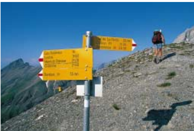
Der Pass La Forcla

Die Tour des Muverans bietet sehr viel: Dort, wo sich das Rhonetal krümmt, entdeckt man auf dieser Höhenwanderung einige der schönsten Ausblicke der Alpen: Sie gehen auf das Montblanc-Massiv, die Combin-Gipfel, die Walliser Alpen, die Dents du Midi und an gewissen Stellen auf den Genfersee. Ebenso spannend ist die Geologie: Die Zeitalter von der Kreide bis zum Jura haben hier ihre Schätze und Spuren zurückgelassen. Kohlehaltige Felsen, Ammoniten, Flintknollen, Schratzen- und Karrenformationen erzählen die Geschichte unseres Planeten. Das ganze Gebiet, das immer noch das Interesse der Wissenschaftler auf sich zieht, ist für Geologen ein Höhepunkt. Die Flora steht dem nicht nach: Hier trifft man auf sehr seltene Arten; so ver-